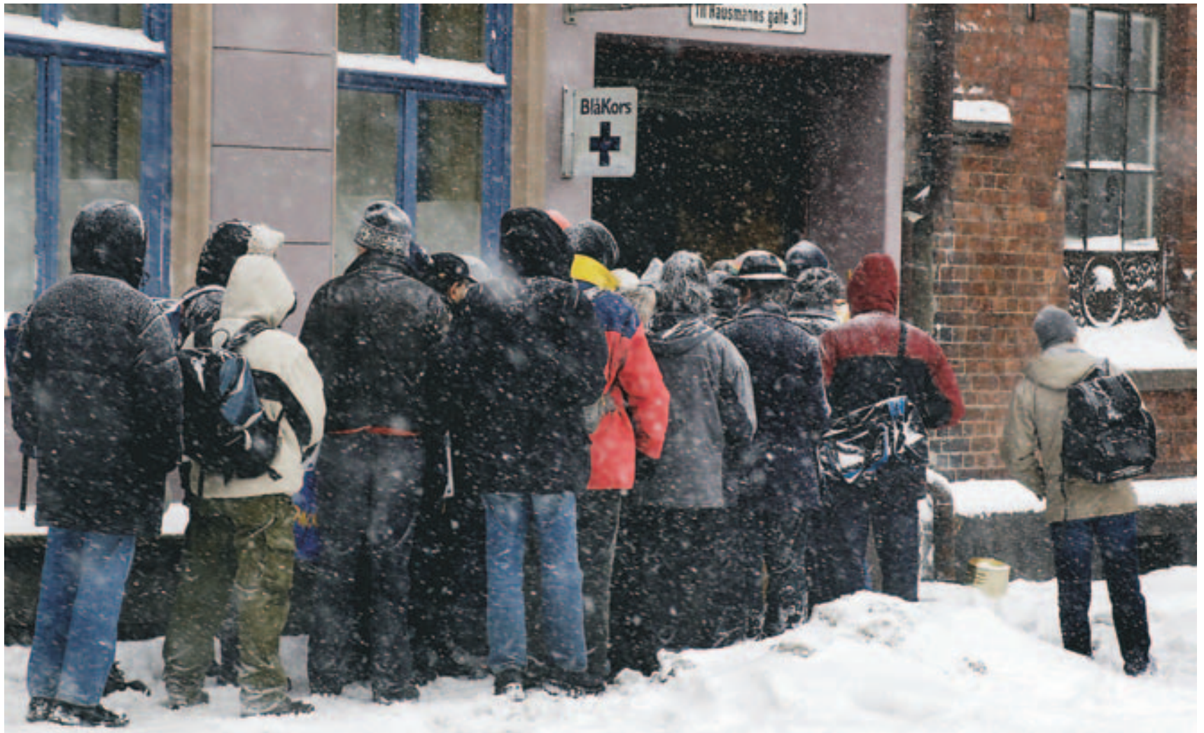
Redningen: En dag i uka deler Kontaktsenteret på Blå Kors ut mat, som brukerne kan ta med hjem. Tilbudet er opprinnelig for folk med rusrelaterte problemer. De siste par åra har senteret fått ei svær, ny brukergruppe: Innvandrere.