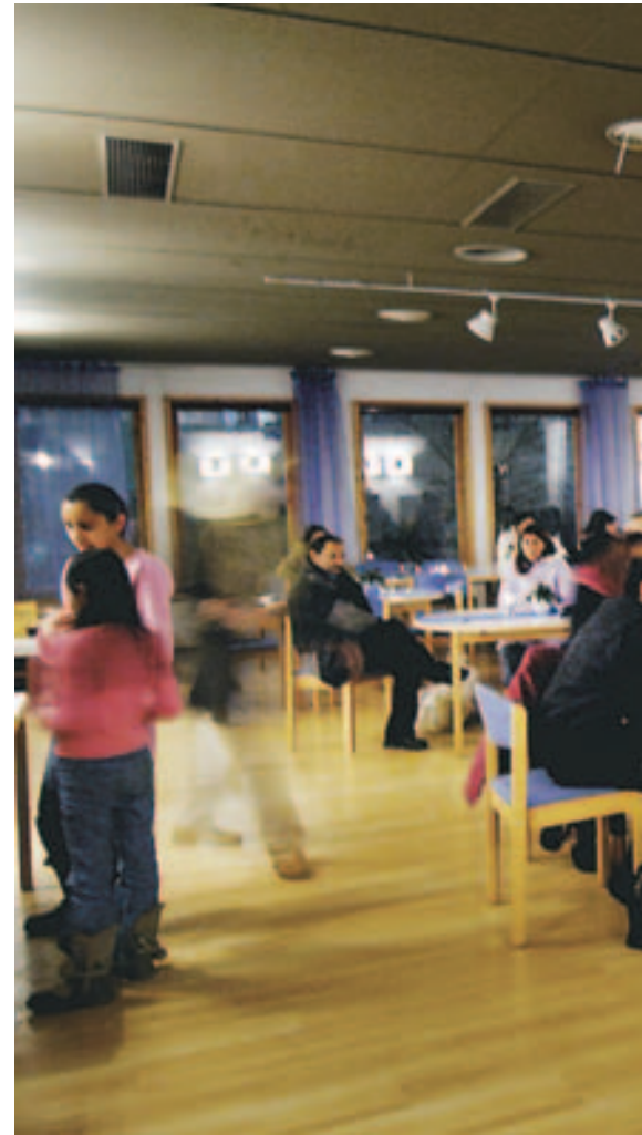
Trygt tilbud: I tillegg til helsetjenester utgjør Rosengrenska har et liv utenfor gjemместedet sitt. Her kan barna leke,