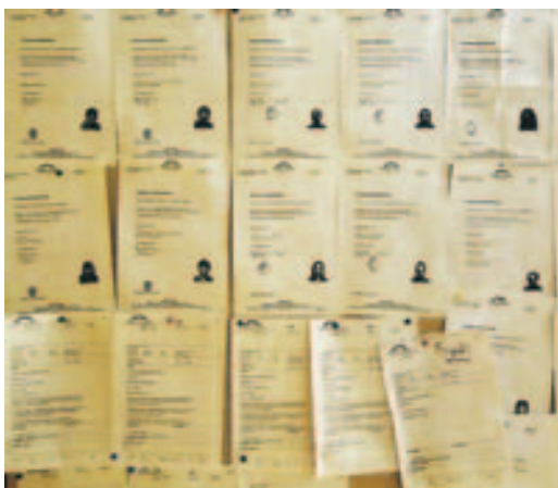
Seierstavle: Mange av pasientene på Rosengrenska har fått amnesti. Oppholdstillatelsene er hengt opp på veggen.

● Amnestiet går ut 31. mars. Ifølge arbeids- og inkluderingsminister Bjarne Håkon Hanssen er et tilsvarende amnesti ikke aktuelt i Norge.