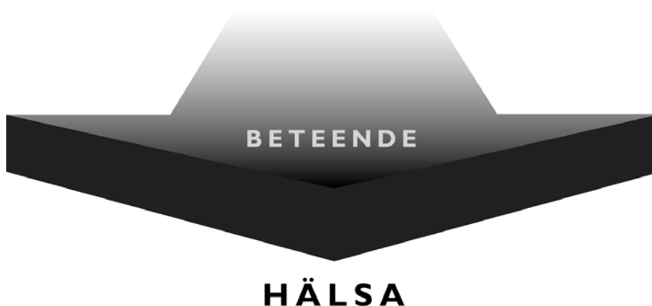
Figur 1. Hälsa-beteendemodellen