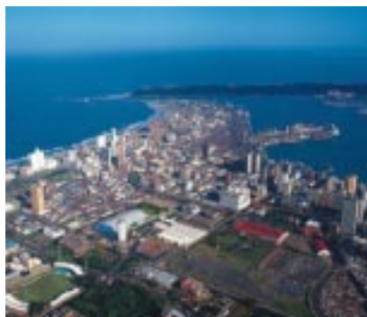
Centrala Durban, Sydafrika