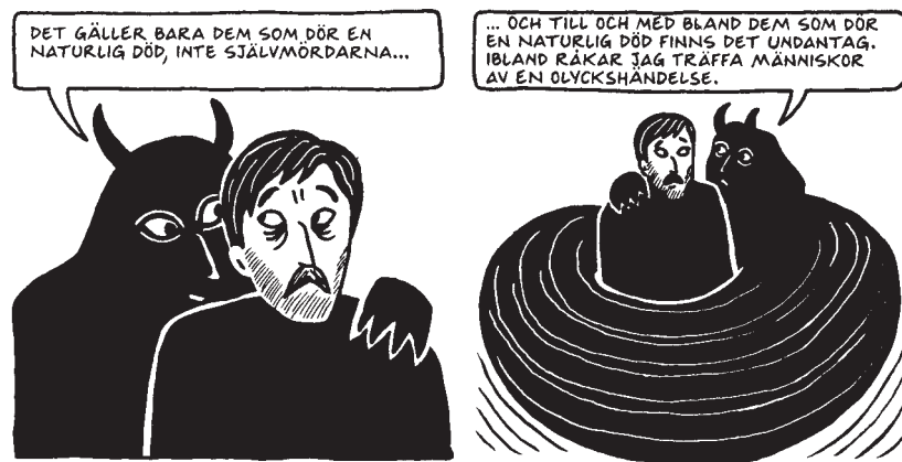
Ur Marjane Satrapis "Kyckling med plommon".