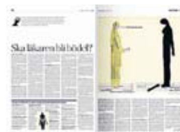
DN den 11 maj.

till asylsökande, papperslösa och flyktingar därför att vi är människor. Vi måste kunna se oss i spegeln utan att behöva skämmas.